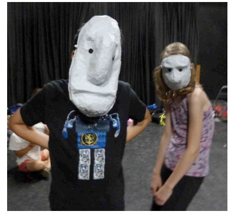
Participants STAGE ESTIVAL 2013 Masques et marionnettes

Pour enrichir et approfondir l'expérience théâtrale des participants, une partie du travail réalisé sera présentée à La Nouvelle Scène à la fin de l'exploration.