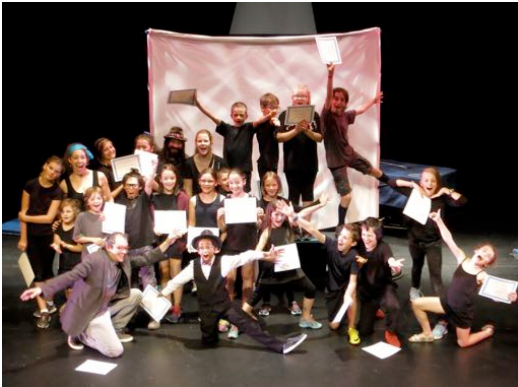
Participants STAGE ESTIVAL 2017 Le théâtre s'invite au cirque

Présenté en collaboration avec le Centre d'excellence artistique De La Salle