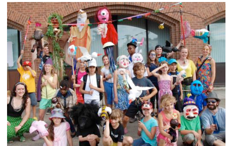
Participants STAGES d'été 2015 Marionnettes et masques – août