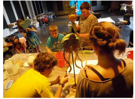
Participants STAGE ESTIVAL 2011 Fabrication de marionnettes

Arrivée des participants Mise en train et mise en confiance Pause Atelier Repas du midi Ateliers et activités connexes Pause Atelier et répétitions Réflexion sur la journée Départ des participants