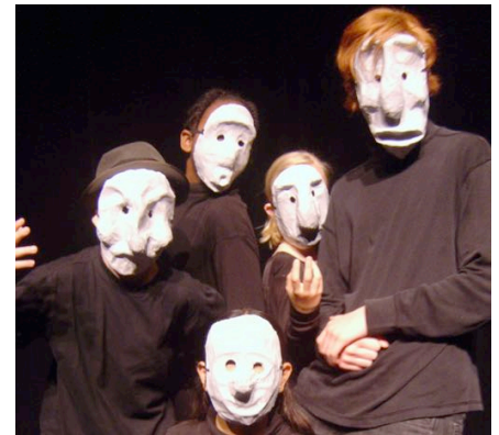
Participants STAGE ESTIVAL 2009 Masques et Commedia dell'arte