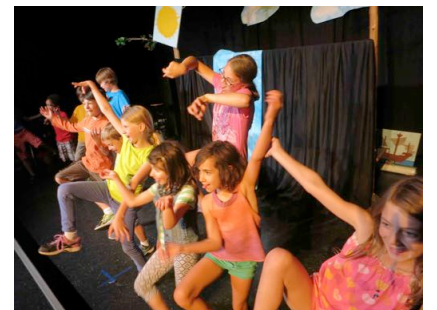
Participants STAGES d'été 2015 Théâtre de création – juillet