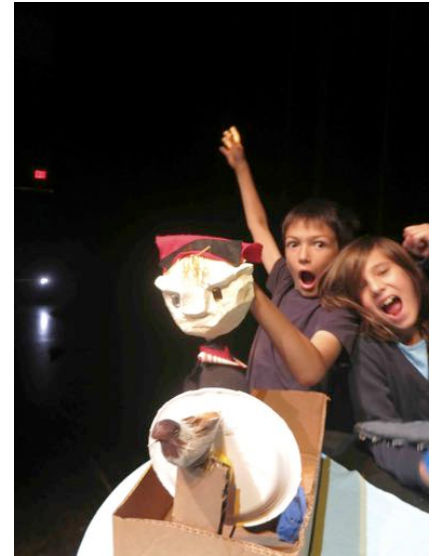
Participants STAGE ESTIVAL 2014 Côté cour, côté jardin

À la fin des stages, les participants présentent leur travail devant leur famille et leurs amis. On voit souvent des « révélations » sur scène. Les jeunes profitent de cette occasion pour s'amuser franchement. On voit aussi beaucoup de solidarité et d'entraide chez les participants qui comprennent vite que le travail d'équipe est indispensable au succès d'une pièce de théâtre. Grâce à cet esprit de solidarité, les participants mettent de côté leurs différences et s'ouvrent aux autres dans un climat de confiance.