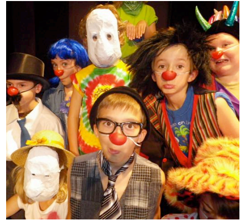
Participants STAGE ESTIVAL 2010 Masques et clowns