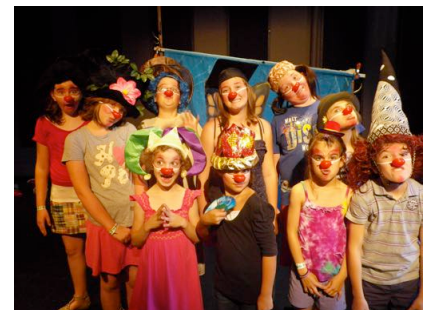
Participants STAGE ESTIVAL 2011 Clowns et marionnettes